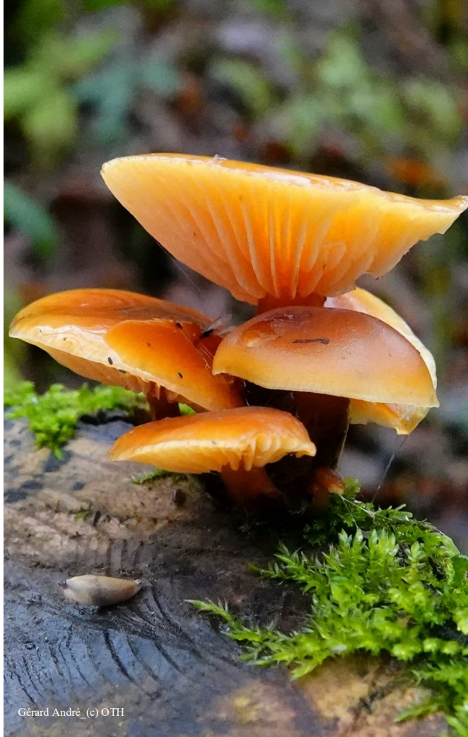
Gérard André (c) OTH

Geniet van een heerlijke maaltijd voor of na de wandeling. Voor de meeste wandelingen, wordt een restaurant in de buurt van het startpunt en de aankomst aangeboden. Het biedt je de mogelijkheid om een maaltijd te nemen tegen een aantrekkelijke prijs. De details van de restaurants en de menu's staan vermeld op de gedetailleerde fiches die verkrijgbaar zijn bij de Dienst voor Toerisme of op onze website.